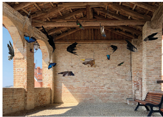
Sabrina Oppo IL BOSCO DELICATO 2019, Installazione site-specific Dimensione ambiente

Impossibile non citare Joseph Beuys : "Ancora per un certo periodo di tempo ci rimane la possibilità di venire liberamente a una decisione, la decisione di prendere un corso che sia diverso da quello che abbiamo percorso nel passato. Possiamo ancora decidere di allineare la nostra intelligenza a quella della natura."