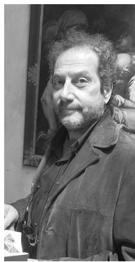
Gian Luca Favetto IL PAESE COL BOSCO PER CAPPELLO 2019, Installazione mappa poetica del Roero