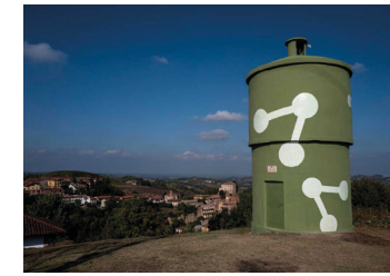
Saverio Todaro Share 2018, Castellinaldo d'Alba, ex torre dell'acqua Pittura murale e resina fosforescente, dimensioni reali